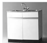
38051 Mietspüle (Abbildung ähnlich)