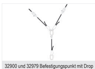
32900 und 32979 Befestigungspunkt mit Drop

Bitte beachten: Zur Bearbeitung der Bestellung ist eine genaue Positions- und Höhenangabe der benötigten Befestigungspunkte erforderlich. Vermaßte Standskizze (Maßstab 1:100 oder 1:50) bitte unbedingt beifügen.